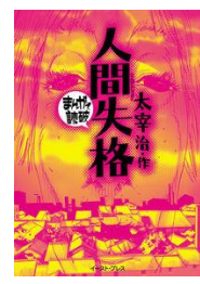
『まんがで読破 人間失格』太宰 治 // 著