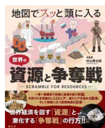
地図でスツと頭に入る世界の資源と争奪戦村山 秀太郎 // 著