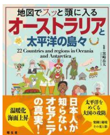
地図でスツと頭に入るオーストラリアと太平洋の島々大野黒崎岳大 // 著