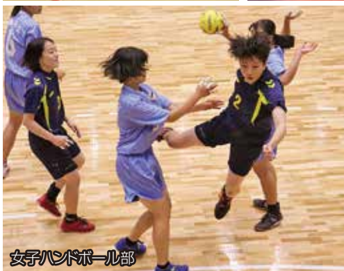
女子ハンドボール部