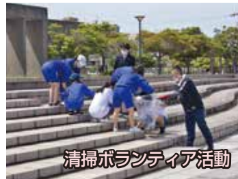
清掃ボランティア活動