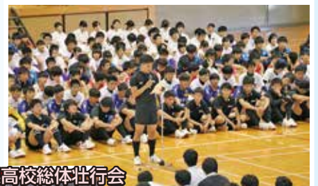
県高校総体壮行会