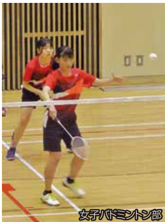
女子バドミントン部