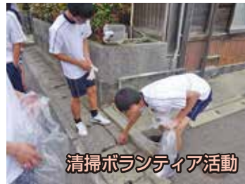
清掃ボランティア活動