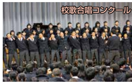
校歌合唱コンクール