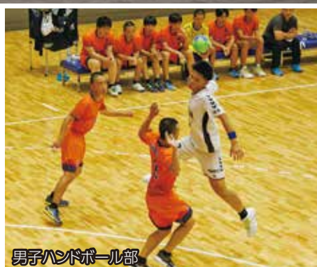
男子ハンドボール部