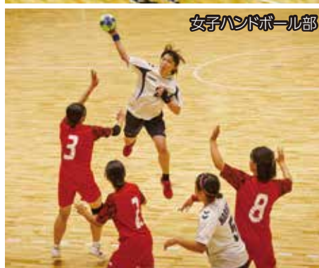
女子ハンドボール部