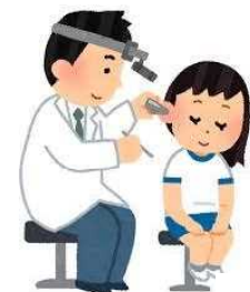
耳掃除を しておこう