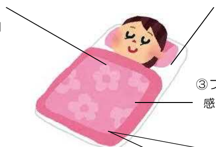
③フィット 感のある